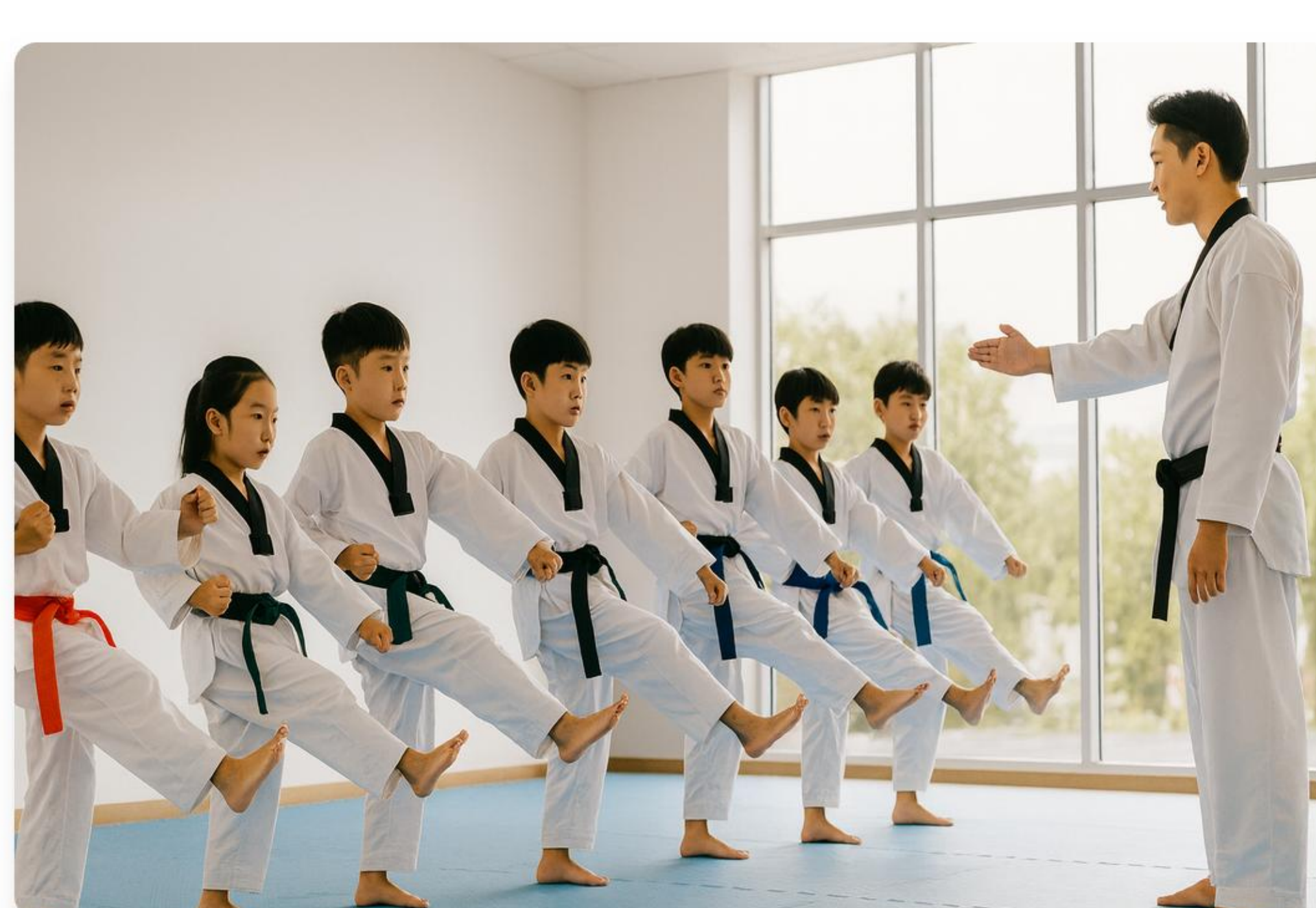
체계적인 교육으로 성장하는 아이들